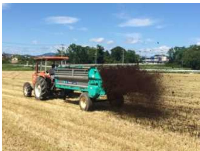
専用機械（マニユアスプレッダー）による堆肥散布

※耕畜連携：畜産農家から耕種農家への堆肥の供給、逆に耕種農家が転作田等で飼料作物を生産し、畜産農家への家畜飼料の供給など、耕種サイドと畜産サイドが連携を図ること。