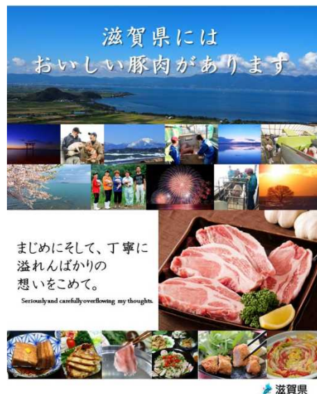
滋賀県産豚肉のPRポスター