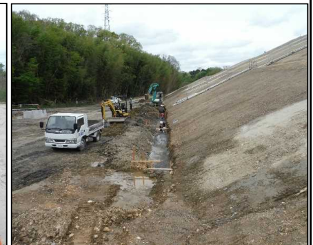
⑤ 雨水排水工 DE工区雨水排水の掘削、床付け、砕石敷均しを行っています。