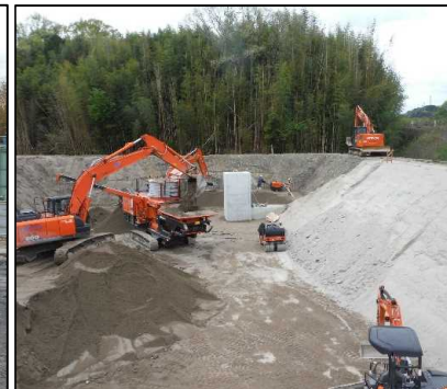
③ 洪水調整設備工 セメント改良土工を行っています。