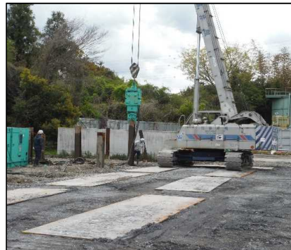
② 選別処理工 H鋼杭の引抜を行っています。