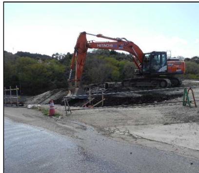
① 選別土仮置・盛土工