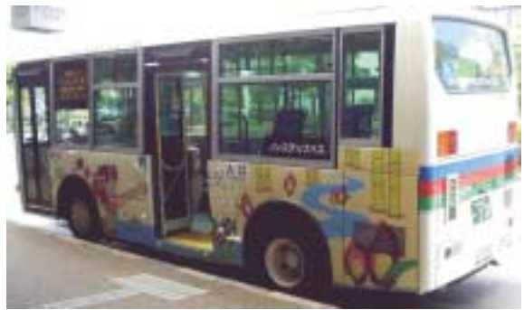
(だれもが乗りやすい段差のない低床バス*)