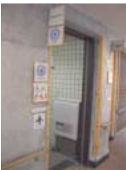
(手すり・ベビーチェア・介護ベット・オストメイト* 設備等を備えただれもが使いやすいトイレ)

これまでは、健康で若く活動的な男性を主な利用者として多くのものが作られてきました。これからは、ユニバーサルデザインの考え方により、高齢者や障害者だけでなく、子ども、外国人、妊婦、大きな荷物を持っている人、乳幼児を連れている人、けがをしている人、病気の人など、様々な人の利用を「はじめから」想定して計画、実施していくことが重要です。