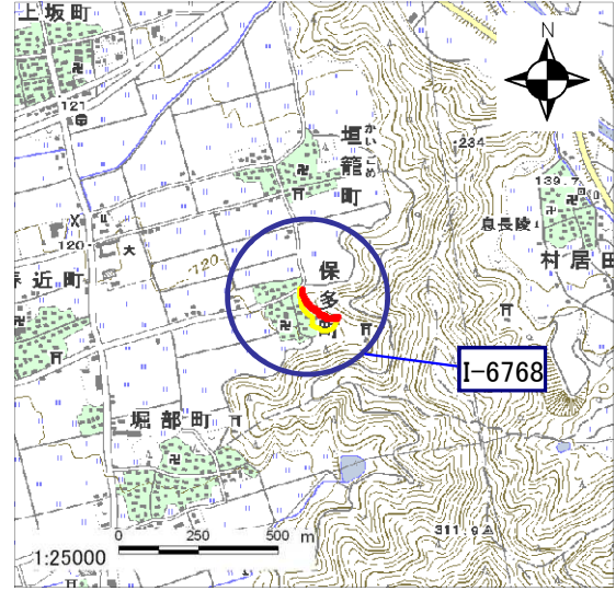
土砂災害警戒区域・土砂災害特別警戒区域 位置図

・この地図は、国土地理院発行の数値地図25000(地図画像)を複製したものである。