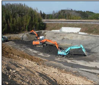
② 選別土仮置・盛土工