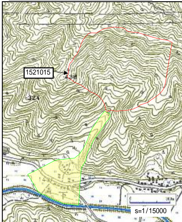
土石災害警戒区域・土石災害特別警戒区域 位置図

この地図は、国土地理院長の承認を得て、同院発行の2万5千分の1地形図を複製したものである。(承認番号 平16総複、第205号)