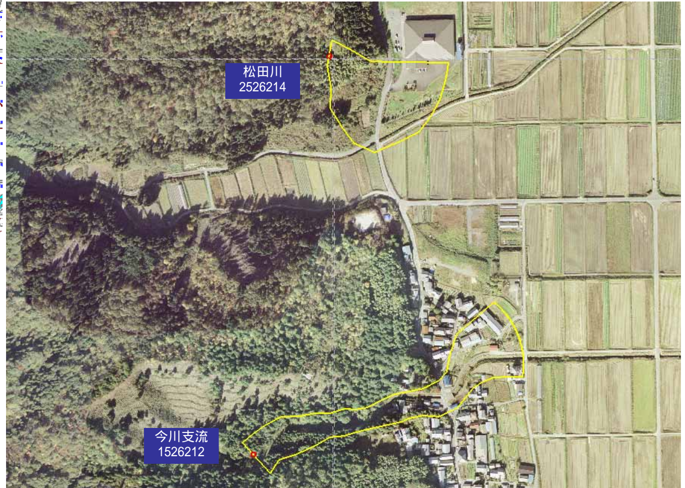
土砂災害警戒区域図

・この地図は、国土地理院長の承認を得て、同院発行の数値地図25000(地図画像)を複製したものである。(承認番号 平16総複、第205号)