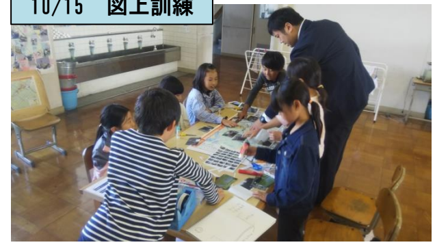
↑地域の危険箇所について地図上で確認・意見交換