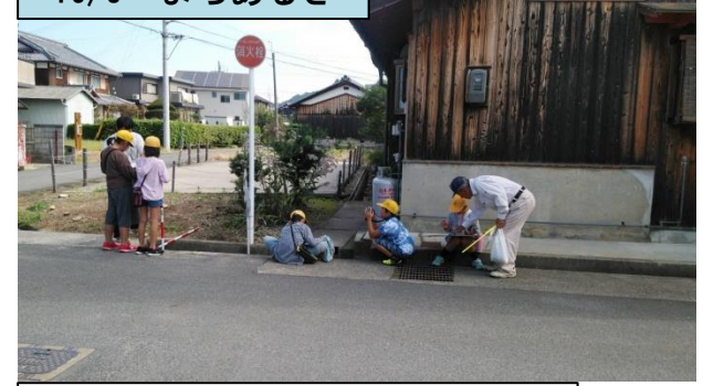
↑地域の危険箇所について現地で確認