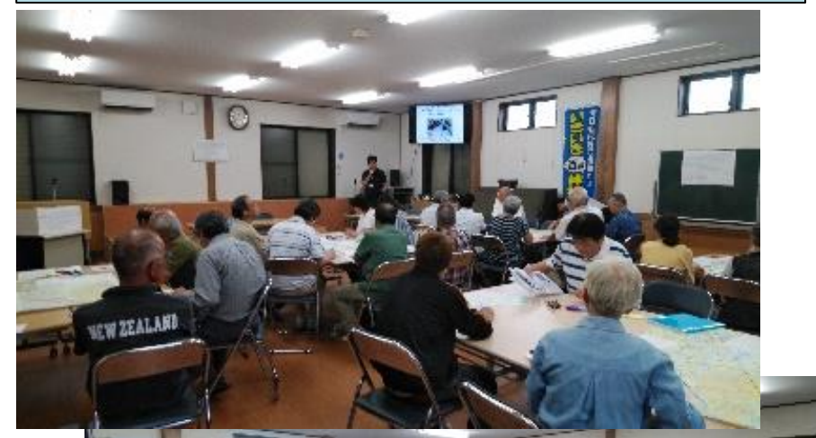
9/22 近江八幡市新中小森自治会 出前講座、図上訓練