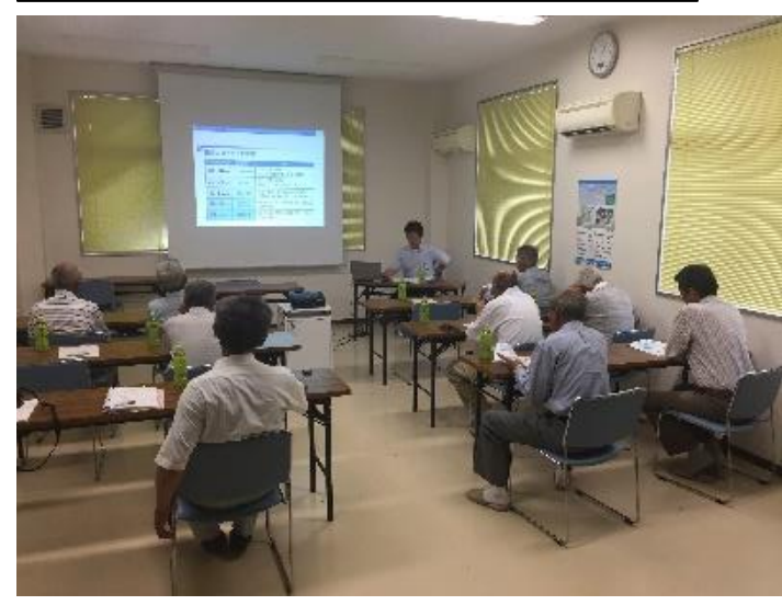
7/11 水茎干拓土地改良区 出前講座