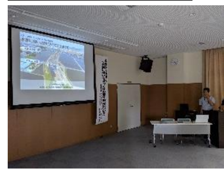
8/25 近江八幡市武佐学区 出前講座