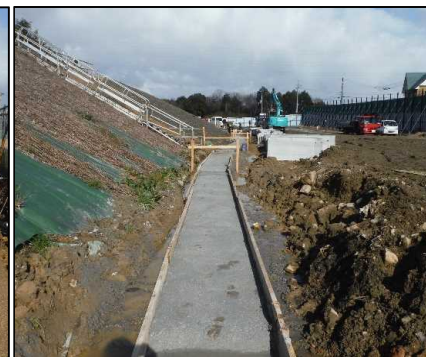
⑤ 雨水排水工 北尾団地側側溝均しコンクリート施工状況です。