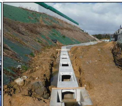
⑤ 雨水排水工 北尾団地側側溝据付状況です。