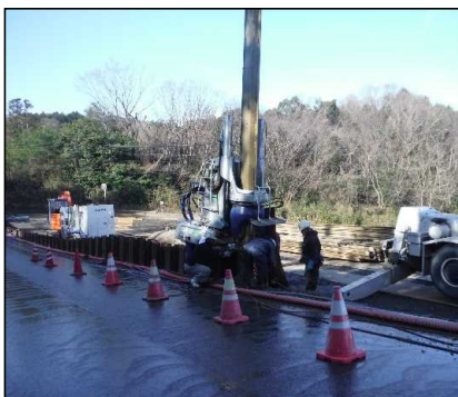
① 有害物掘削工 I区画の鋼矢板を引き抜いています。