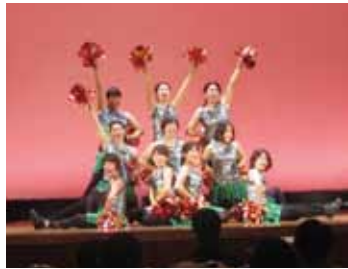
▲子育て中のママで結成しているチアダンスチーム「ママチア滋賀・スパーキージェム」によるオープニングパフォーマンス

当日は150名を超える参加者を前に、マスオさんやジャムおじさんの声を交えながら、幸せ見つけのヒントをわかりやすくお話しくささいました。