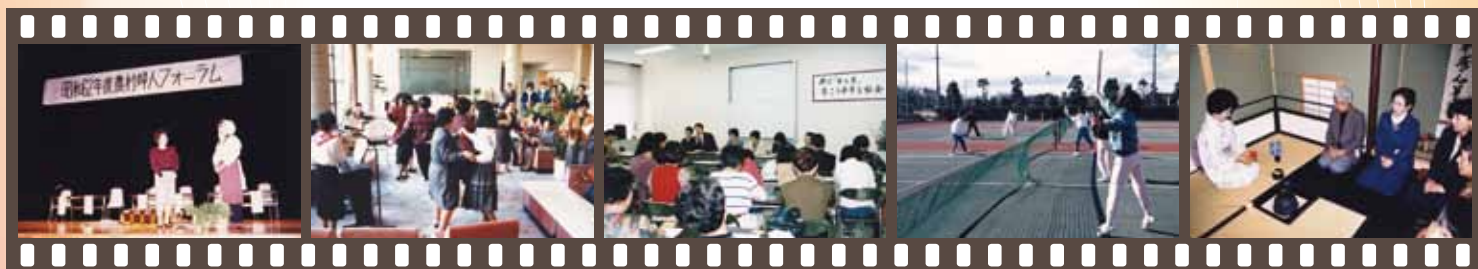
▲ 昭和62年、センター開所1周年当時の様子。 「農村婦人フォーラム」をはじめ、「女性学講座」、「男性学講座」などの研修会やスポーツ・文化講座など、当時から幅広い活動が展開されていました。