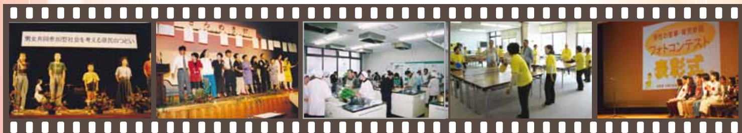
▲ 「きらめきフェスティバル」(現在はG-NETしがフェスタ) や、各団体による講座など、県民が主体となった取り組みは現在まで続いています。