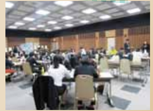
キャリア形成について、気持ちの充実度をあげるための手立てなどを参加者同士でも交流しました。