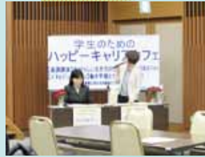
「管理職のやりがいは…」「育休からの仕事復帰で大変なことは…」など、先輩社会人からのアドバイスを聞くことができました。