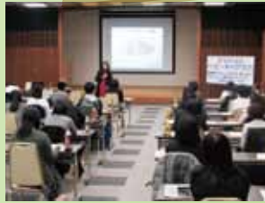
「皆さんは今、『静かな革命』(女性の役割の変化)にリアルタイムで立ち会っています！」先生のお話に耳を傾ける参加者。