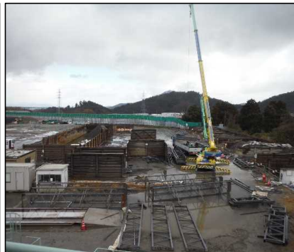
③ 選別処理工 選別建屋の解体撤去を行っています。