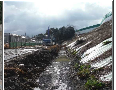
⑤ 雨水排水工 北尾団地側側溝基礎砕石施工状況です。