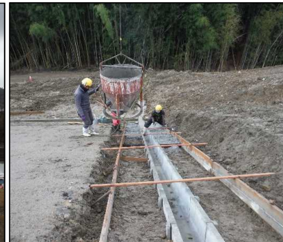
⑤ 雨水排水工 縦排水の張りコンクリートを打設しています。