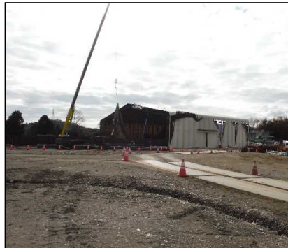
③ 選別処理工 選別建屋の解体撤去を行っています。