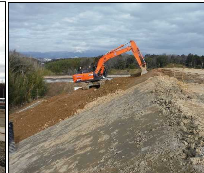
④ キャッピング工 C工区法面覆土の整形を行っています。