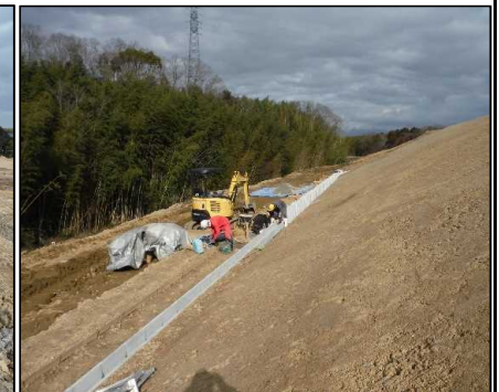
⑤ 雨水排水工 DE工区2段目小段U字型側溝を設置しています。