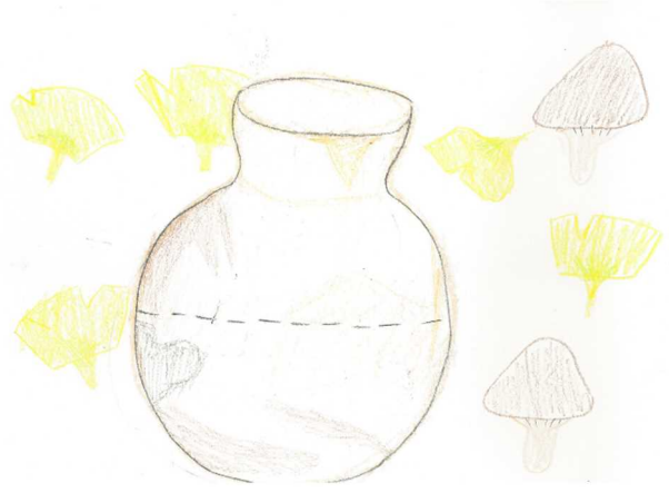
壺とイチョウ 中学1年生（12歳） （笠原南遺跡出土）