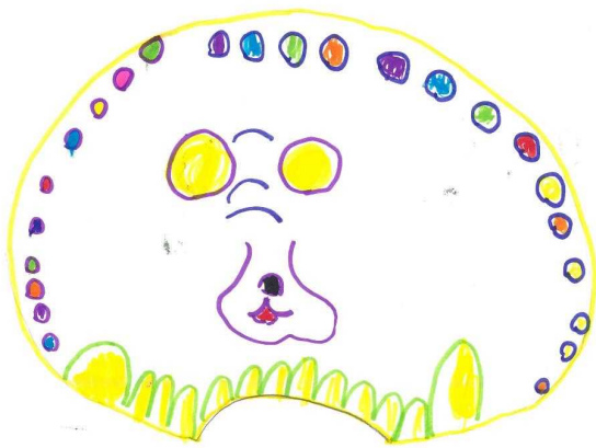
かわいい鬼瓦 小学1年生（6歳） （近江国府跡出土）