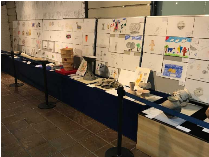
昨年度のびわこMyぶん祭 での展示状況 (上・右)