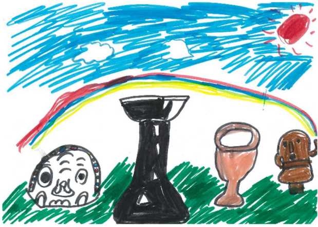
鬼瓦と土器と虹 小学2年生（7歳） （近江国庁跡他出土）