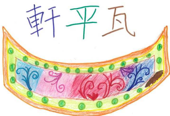
古代の役所で使われた瓦 小学5年生（11歳） （近江国庁跡出土）