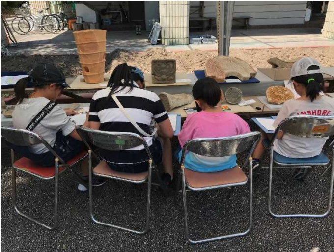
Myぶんドキドキ観察会で 作品を制作している様子 (上・右)