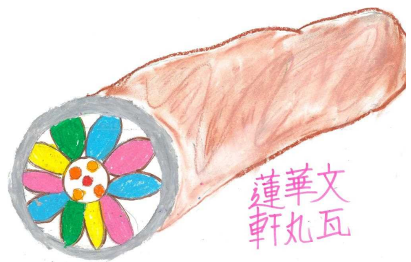
古代の役所で使われた瓦 小学5年生（11歳） （近江国庁跡出土）