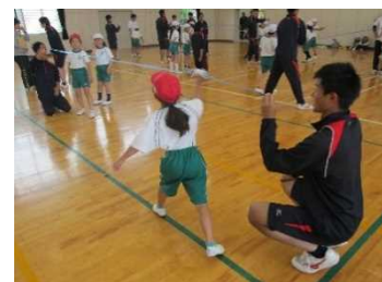
体育授業サポート体験