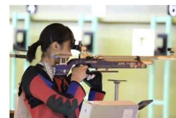
部活動(ライフル射撃部)の活動風景