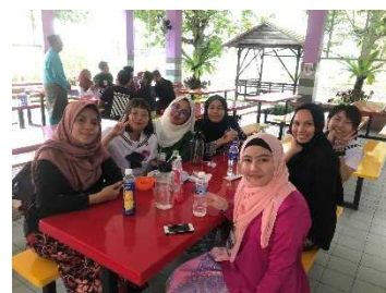
マレーシア海外研修