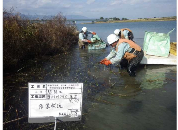
野洲川河口部での駆除状況