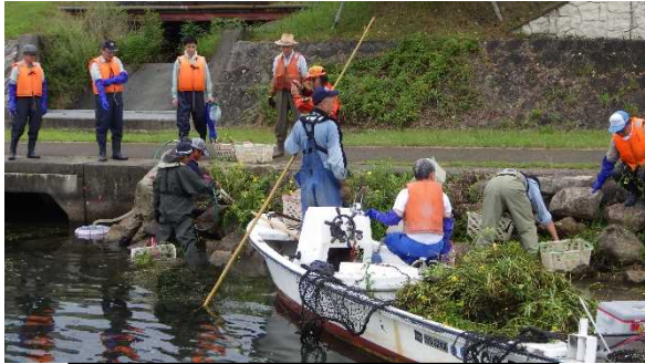
瀬田川での駆除デモ