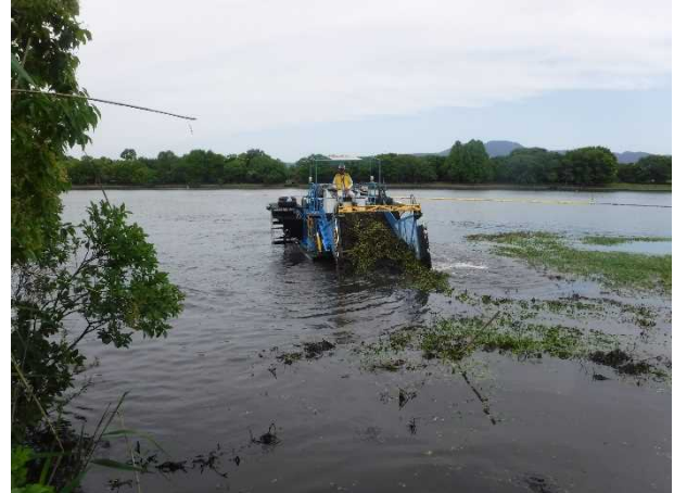
中間水路での駆除状況