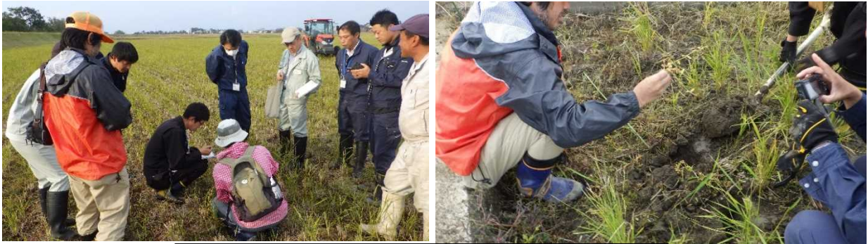
東近江市栗見出在家町の農地での緊急駆除