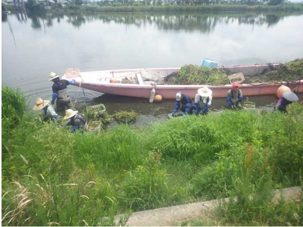
木浜水路での駆除状況