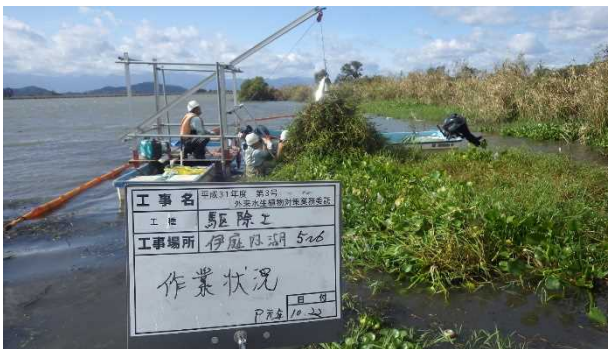
伊庭内湖での駆除状況