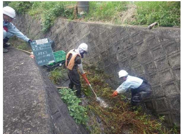
大津市富士見台 水路での駆除状況