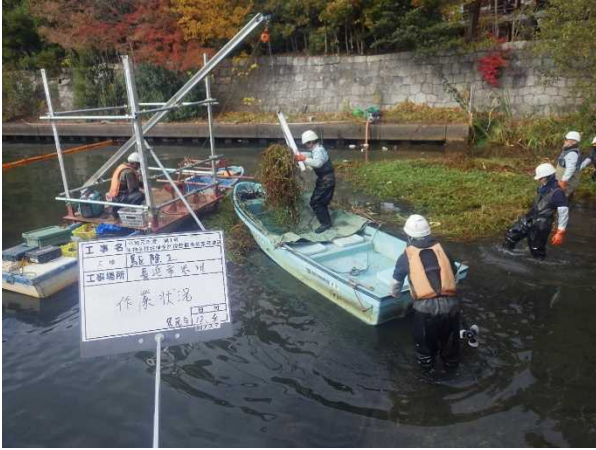
米川での駆除状況