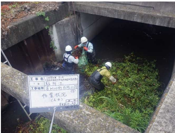
芹川内陸水路での駆除状況