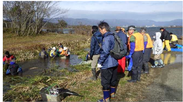
高島市新旭町饗庭での駆除デモ