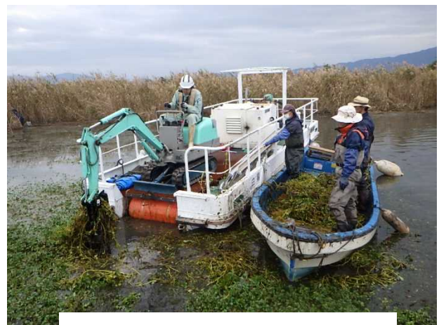
津田江内湖での駆除状況