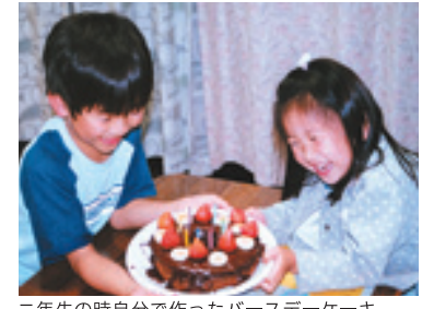
二年生の時自分で作ったバースデーケーキ

たまには失敗もありますが、その度に来ることも増えていくようです。こんな風にひとつひとつ、必要なことを自分で出来るようになっていって欲しいですね。