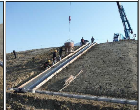
⑤ 雨水排水工 縦排水の張りコンクリートを打設しています。