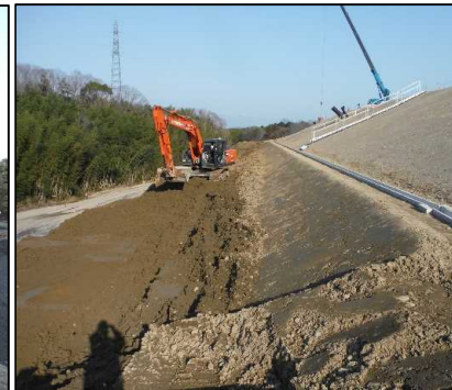
④ キャッピング工 DE工区の2段目法面の覆土整形を行っています。