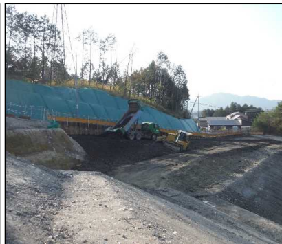
② 選別土仮置・盛土工 E工区、I区画の盛土を行っています。