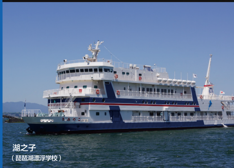
湖之子 (琵琶湖漂浮学校)