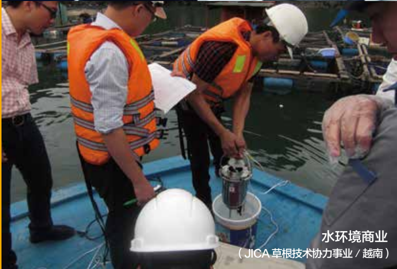
水环境商业 (JICA 草根技术协力事业 / 越南)