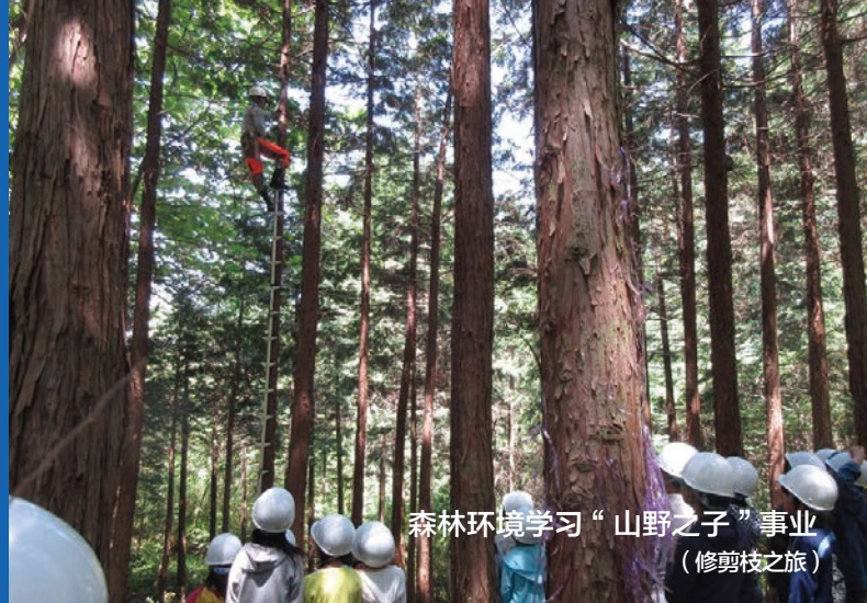
森林环境学习“山野之子”事业 (修剪枝之旅)