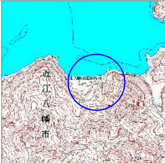
土砂災害警戒区域・土砂災害特別警戒区域 位置図

この地図は、国土地理院長の承認を得て、同院発行の数値地図25000(地図画像)を複製したものである。 (承認番号 平16総複、第205号)