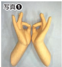
写真① 阿彌陀如来像の指の形

こうした多彩な仏像の名前は、髪形や着衣、持ち物、手の指のポーズなどに注目すると、実は分かりやすいのです。写真①は阿彌陀如来の手の指のポーズです。親指と他の指とで「輪」をつくっていることがわかりますね。実は指で「輪」の形のポーズをとる仏像は、すべて阿彌陀如来像です。阿彌陀如来の放つ、何物にもさえぎられない清らかな光を輪の形で表しているともいわれます。他にも、馬頭観音は手の指で馬の口の形を表していることが多くあります。