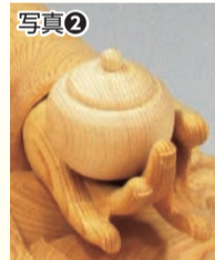
写真② 薬師如来像が持つ薬壺

持ち物で区別のしやすい仏像もあります。薬師如来は写真②のように、左の手のひらに「薬壺」を持っているのが通常です。また、観音菩薩は左手に花がつぼみの状態の蓮華を持っている例が多く、不動明王は「羅索」と呼ばれる投げ縄を左手に握っています。文化財保護課が編集した鑑賞ガイドブック『1冊でわかる滋賀の仏像』(県内の公立図書館で閲覧可能です。書店でも販売されています。)などで、さらに深く薬師如来像が持つ薬壺 学んでみてください。