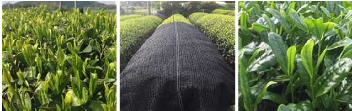
図1 「せいめい」の一番茶における直がけ被覆栽培の様子 (左：被覆開始時 1.5葉期、中央：黒色資材による直がけ、右：被覆15日後)