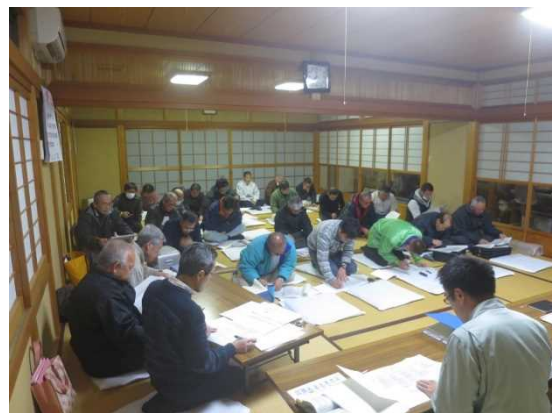
写真 上田中ほ場整備実行委員会での検討

中間管理事業関連農地整備事業を希望している安曇川町上田中地区では事業採択に必要な営農計画作成のため、現在の耕作者の状況把握と農地整備後の農地利用計画の作成支援を行いました。また、安曇川町本庄地区では担い手間のほ場交換による農地の集約（連担化）に向けた支援を行いました。