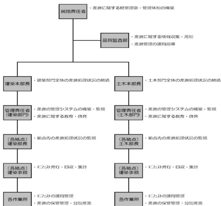
(別図-2) 産業廃棄物の処理に係る管理体制