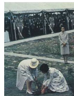
皇后陛下お手植え (モミジ)