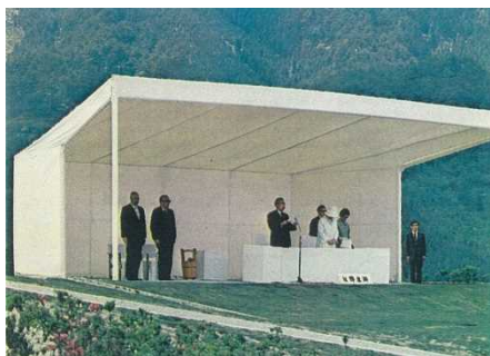
天皇陛下のおことば