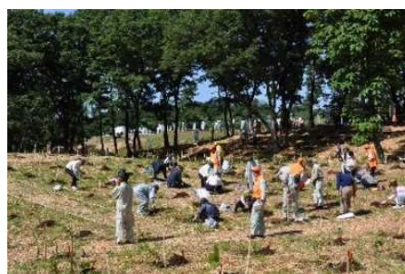
植樹会場 (第68回全国植樹祭〔富山県〕)