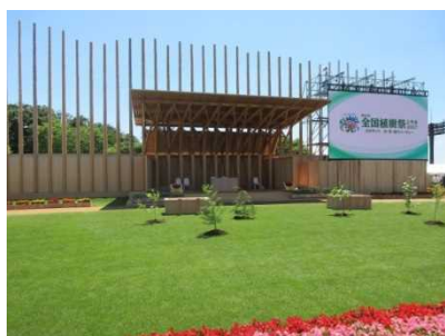
県産材を活用したお野立所 (第68回全国植樹祭〔富山県〕)