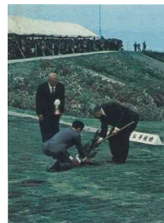
天皇陛下お手植え (ヒノキ)