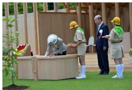
皇后陛下お手播き (第68回全国植樹祭〔富山県〕)