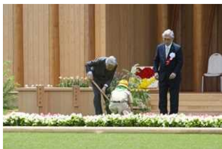
天皇陛下お手植え (第68回全国植樹祭〔富山県〕)