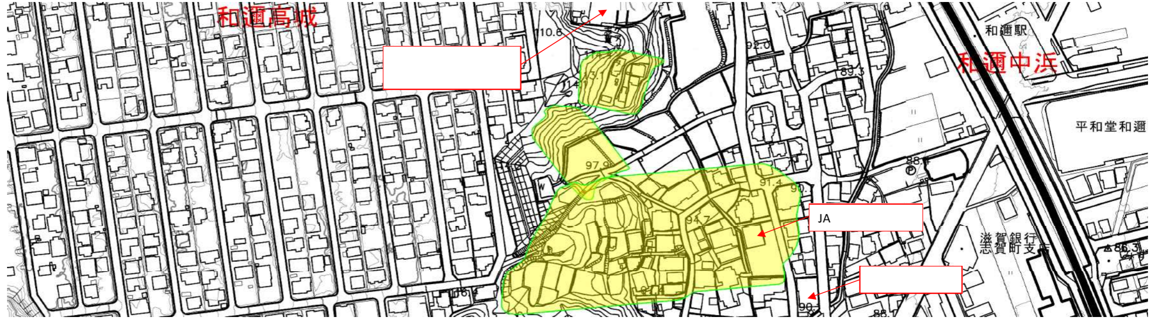
土砂災害警戒区域・土砂災害特別警戒区域 位置図