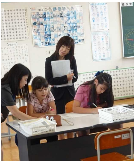
通訳による日本語教室指導（長浜市長浜北小学校）