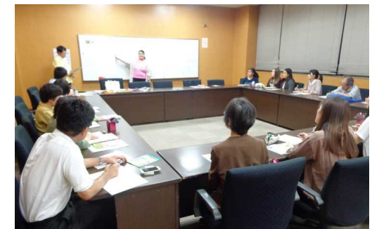
地域ボランティアや教職員を対象としたポルトガル語講座（ボランティアグループ「カリニョ」主催）