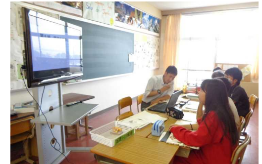
自動翻訳機を活用した日本語教室指導（湖南省立日枝中学校）