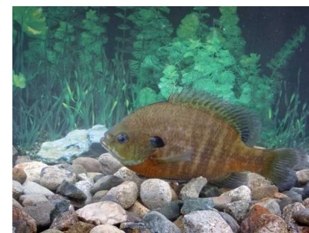
平成30年度に激減したブルーギル