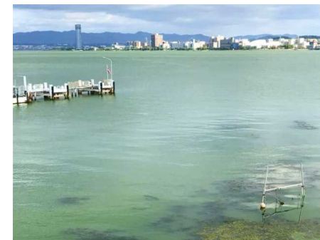
一面緑に染まった南湖(8月)