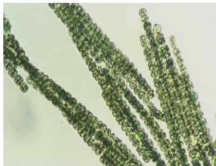
南湖で大増殖したアハナ・アフィニス(8月)