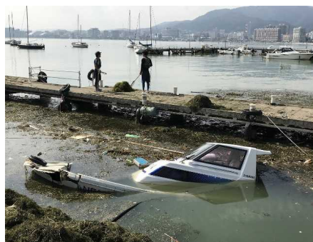
台風21号で座礁した船舶と多量の水草(9月)

平成31年4月には、琵琶湖の全層循環が観測史上初めて未完了になったということで大きなニュースになりました。全層循環のメカニズム等についての詳細は、本資料の「琵琶湖の底質」項目にあるトピックを参照してください。5月末時点では底層の溶存酸素濃度(DO)は7mg/L前後であり、多くの生物の生息環境に悪影響を与える2mg/Lを下回ってはいませんが、例年よりは低い濃度であり、今後の推移が懸念されます。