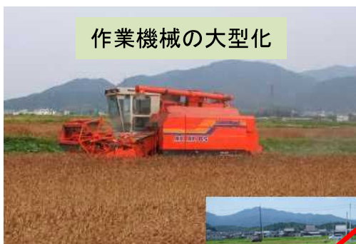
作業機械の大型化