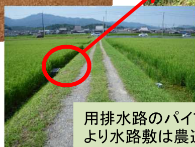
用排水路のパイプライン化により水路敷は農道として利用