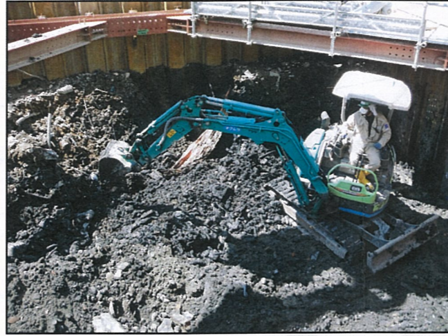
写真① 2次掘削状況(廃棄物土)