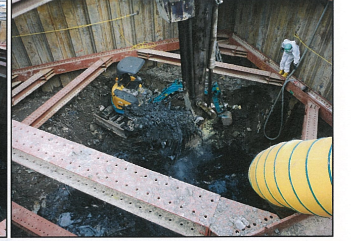
写真③ 3次掘削状況(有害物土)