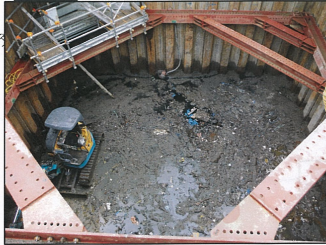
写真④ 有害物土掘削完了底面状況