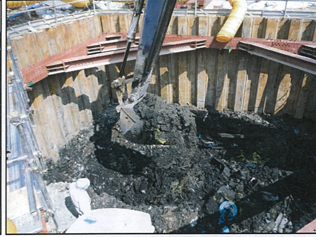
写真② 2次掘削状況(有害物土)