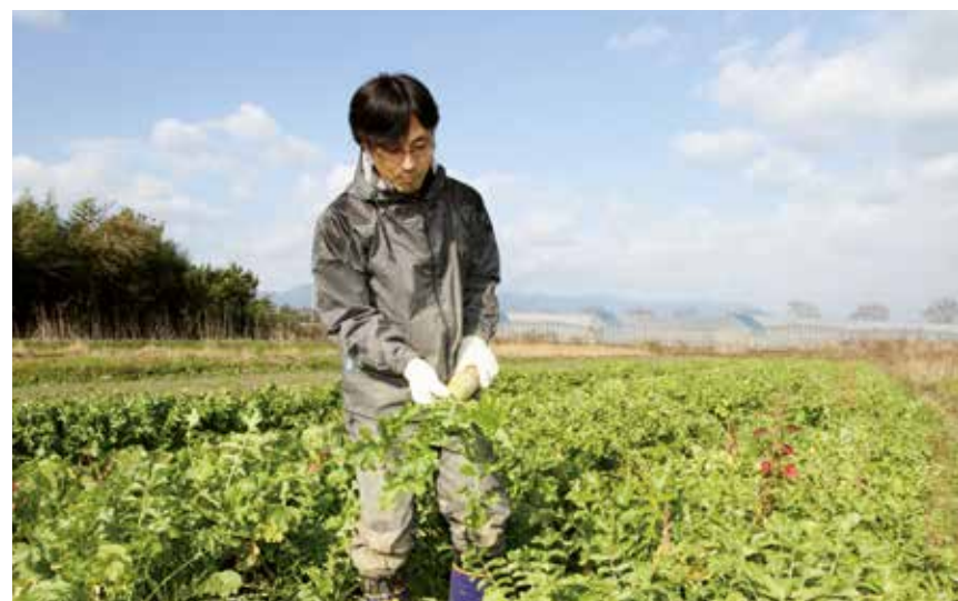
▲ 生産物はすべて、農薬も化学肥料も使わずに栽培。

独立を決心した際、周囲の人たちの反応からは戸惑いを感じましたね。私もですが「農業＝仕事」というイメージがあまりなかったんです。不安もありましたが、就農後は農地周辺の先輩農家さんの所で研修させてもらったり、出荷先で知り合った同業者に話を聞いたり、全国農業改良普及支援協会による「普及指導センター」に野菜の作り方から経理の仕方までを教えてもらったりと、様々な方々にサポートしていただくことができ、15年続けてこられました。当初から農地面積は50アール。ハウスは6棟設け、大根や水菜など50種程の根菜・葉菜を、農薬も化学肥料も使わずに1人で生産してきました。仕組みを学びたかったので、ハウスは1棟だけ自分で建てたんですよ。思った以上に大変でした(笑)実際に就農してみて、いかに自分が勉強できていなかったのかが、身にしみてわかりましたよ。種まきから管理、収穫まで、自分でやってみてわかったことがたくさんあります。初めの頃は生協への出荷がほとんどでしたが「お客様の顔が見たい」という思いから朝市への出店などで徐々に販路を拡大、3年程で直販に移行しました。就農して7年程度でお客様も増え出し、現在、50軒以上ある顧客のうち、9割は県内の個人宅やレストランです。お客様の「美味しい」という声は大きなやりがいになっていますね。