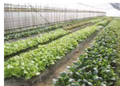
▲ ハウス内には水菜や小松菜などが並ぶ。

農業は「作る」と「売る」の2本柱で成り立つと思っています。今までは「売る」を重要視してきましたが、最近では注文に供給が追いつかなくなっており、今後は生産量の安定を目指し、「作る」に力を入れていくつもりです。今では農業の方が自分に合っていると実感しています。