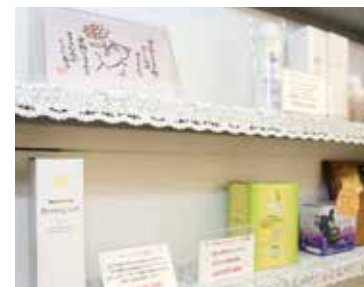
▲ おすすめアイテムがズラリ。

ようにも感じましたが、持ち前の明るい性格と、周囲のバックアップもあり、平成28年に4年目を迎えることができました。現在は月に70人前後の患者様の施術をしていますが、中には精神的ストレスが原因で腰痛などを発症される方も。サロンでは心身共に癒せるよう、お悩みを聞きながら改善策を一人ひとりとしっかりお話しています。「先生の顔を見ただけで元気になった」と嬉しいお言葉をいただくこともあるんですよ。最近では、「脊柱模型」を使った「骨盤の大切さ」を広めるイベントやセミナーの実施にも力を入れています。様々な場所で開催しているのですが、時には参加者数が思っていた