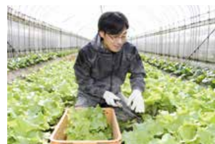
▲ 出荷先からのリクエストにも答える。