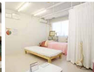
▲ 女性らしさが漂う室内。