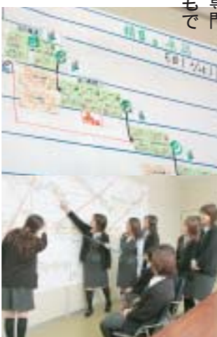
「巻紙分析」で事務作業を見直し。大きな紙に実物の帳票を張りつけて、作業の流れを目に見えるようにして分析する