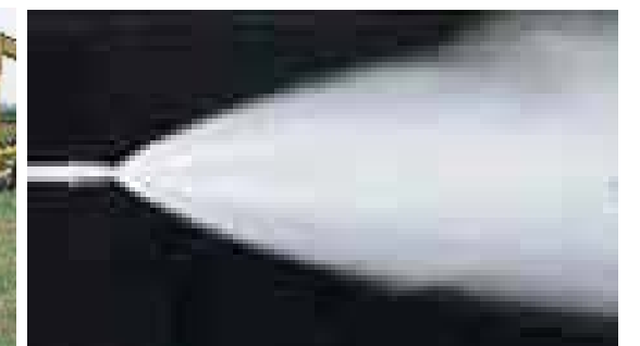
写真-4.4.3 ミスト散水の例