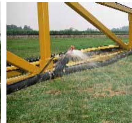
写真-4.4.2 スプレー散水の例