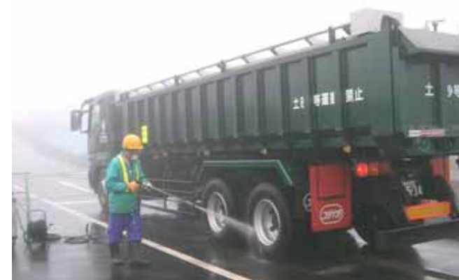
写真-4.4.5 廃棄物運搬車両の洗浄（天蓋付き車両）