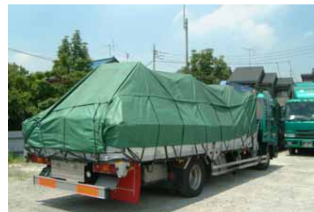
写真-4.4.4 廃棄物運搬車両（シートで覆った事例）