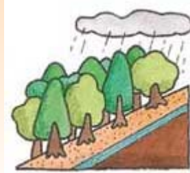
森林があると土が流れにくい

森林の土は、落ち葉や下草におおわれています。雨が降った時、この落ち葉や下草が土砂が流されるのを防いでいます。また、木の根は地中に広く深く伸び、地面をしっかりと固定しているので山崩れを起こりにくくしています。