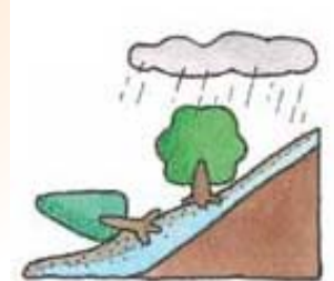
森林がないと土が流れやすい