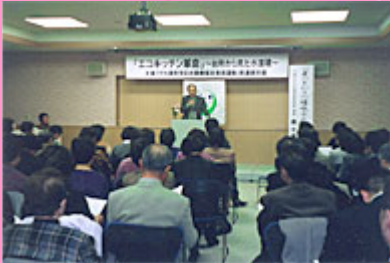
2000年 エコキッチン革命シンポジウム 開催

せっけん運動に代わる新しい運動の一つ「エコキッチン革命」を県下にどう広げていくのかに焦点をあて開催。分科会では今後の運動の進め方など活発な議論が交わされました。