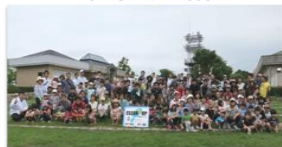
クリーンアップ (スポーツの森)

社員の各種環境イベントへの積極的な参画により、環境に対する理解の深耕と意識の向上。