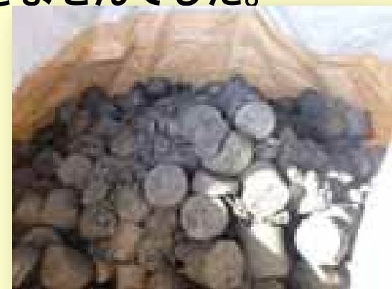
脱液固形化した研削くず (ブリケット)

研削くず以外の金属くずはリサイクル業者に委託できていましたが、研削くずは水分を多く含み、排出量も多く、運搬過程においても注意を必要とするため、リサイクルできる業者をなかなか見つけることができませんでした。