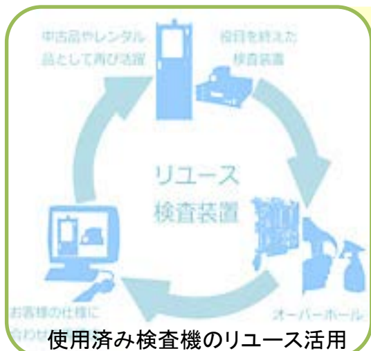
使用済み検査機のリユース活用

お客様の工場などで役目を終えた検査機のリユースへの取り組みを実施しています。廃棄する前にリユースできる部品がないかどうか検討し、使用可能な場合は、適切な処理を施した上で中古品やレンタル機として生まれ変わります。