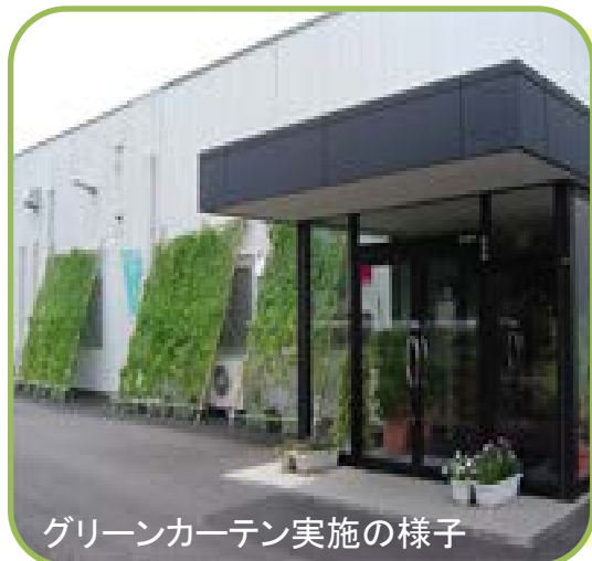
グリーンカーテン実施の様子

職場の照明設備について省電力タイプの蛍光灯やLED照明への交換などを可能な場所から順次実施しています。また、毎月の使用電力量を『見える化』し、職場全員で照明やエアコンの消し忘れなどの防止に取り組んでいます。