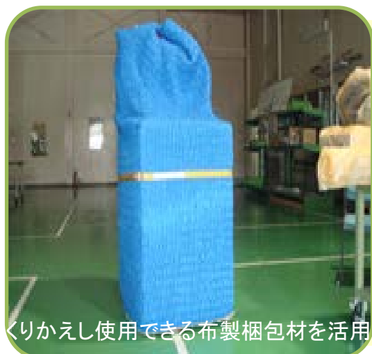
くりかえし使用できる布製梱包材を活用

製品出荷時の梱包材として繰り返し使用できるプラスチック製ダンボールや布製梱包材を積極的に活用しています。また、緩衝材のリユースにも取り組んでいます。