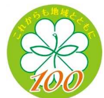
100周年 シンボルマーク