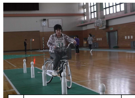
高齢者自転車大会