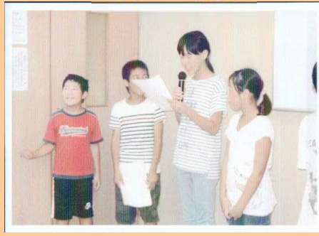
子どもたちの声で事故防止を呼びかけ