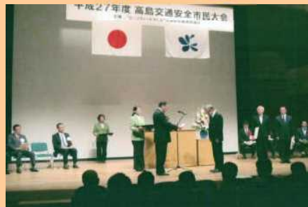
高島交通安全市民大会を開催