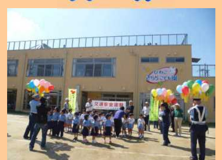
びわこきららこども園で交通安全教室