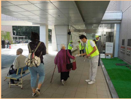
来院者に対する反射材配布（ピカッ作戦）