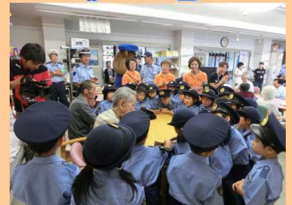
ジュニアポリスと高齢者訪問