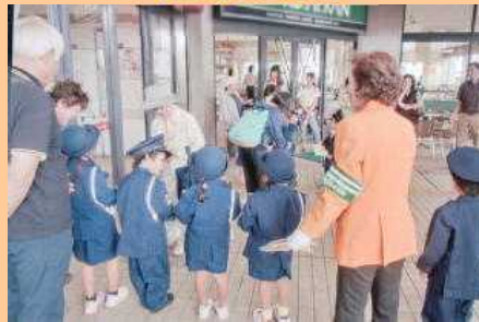
イオンで交通安全啓発