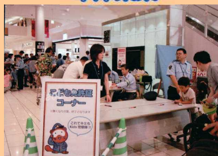
草津イオンモールでキッズ警察隊・子供免許証作成