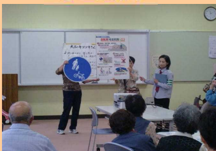
吉山中町老人クラブで交通安全教室