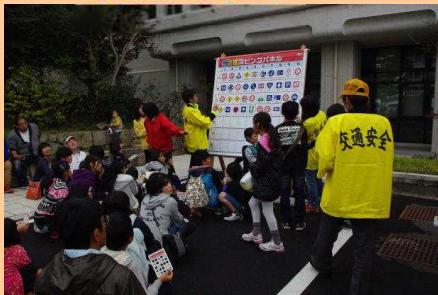
二五八祭りで交通安全啓発