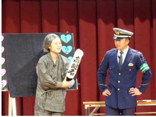
優勝した東近江チーム

11月18日(水)、滋賀県庁新館7階大会議室で「第6回滋賀県交通安全教育コンクール」(主催:公益財団法人滋賀県交通安全協会・滋賀県警察本部)を開催しました。