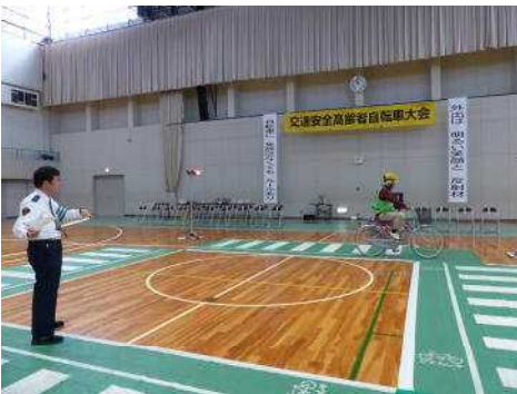
信号交差点で二段階右折