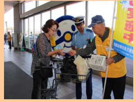
量販店で交通安全啓発