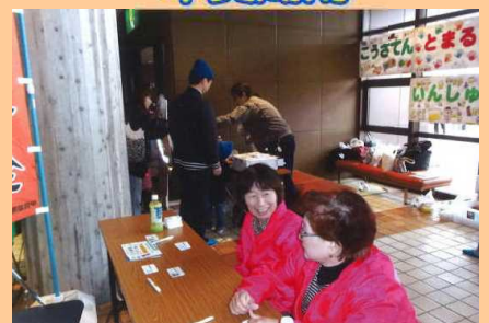
こにゃん元気市場(湖南市)で交通安全啓発