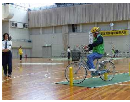
慎重にピンの間を走行