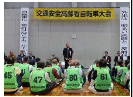
開催式で杉野会長あいさつ