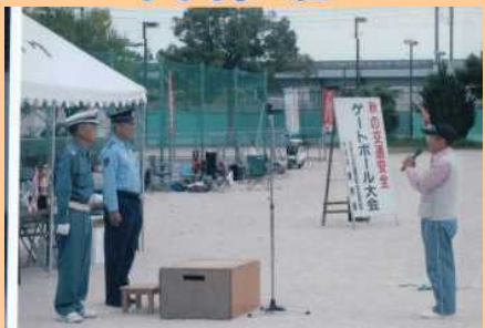
秋の交通安全ゲートボール大会を開催