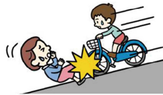
小学生の児童が自転車で坂を下っている際に女性と衝突。被害者は寝たきりの状態となった。