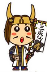
公式キャラクター三成くん