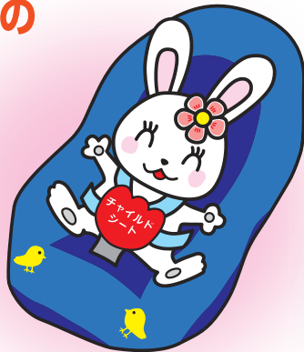
チャイルドシート着用 推進シンボルマーク 「カチャピヨン」