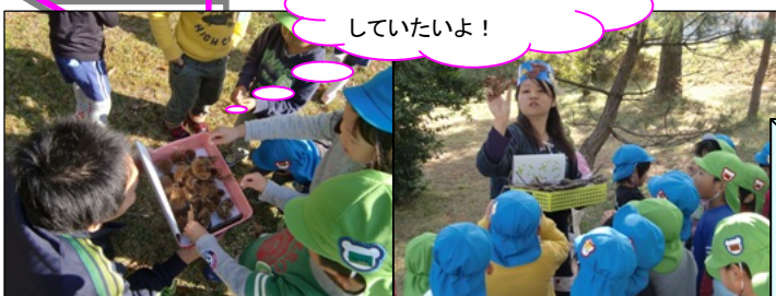
▲テーマに沿った自然物集め