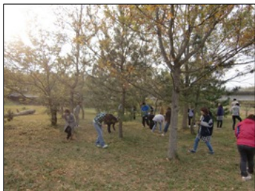
▲使えそうなものを探します