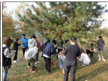
▲落ち葉やどんぐりなどを探し、自然物を使ってジャンケンをします