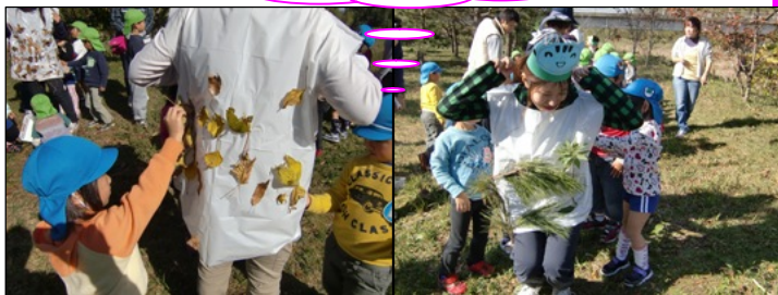
▲各色の自然物を貼り、洋服作成