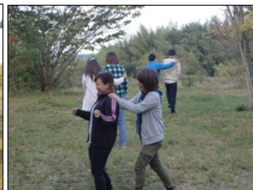
▲目を閉じて、移動した先で数秒見た木はどれか当てます。木には様々な特徴があることを学びます。