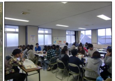
▲班に分かれてプログラム作り