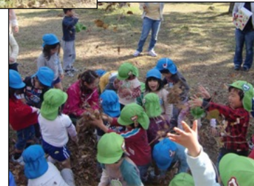
▲お湯(葉っぱ)のかけ合いっこ