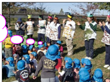
▲「緑・赤・黄・茶」4色の服のファッションショー