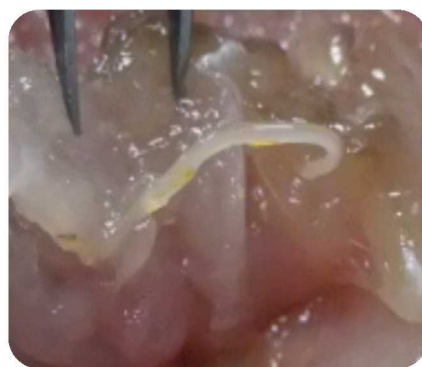
サバ筋肉中のアニサキス写真