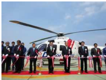
ドクターヘリ就航式