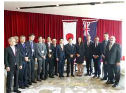
クイーンズランド州政府にて

また、平成 33 年(2021 年)の「ワールドマスターズゲームズ 2021 関西」開催に向けて、ニュージーランドで開催されたオークランド大会を調査し、関西大会準備に向けた情報収集および滋賀の P R を実施しました。