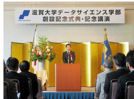
滋賀大学データサイエンス学部創設記念式典