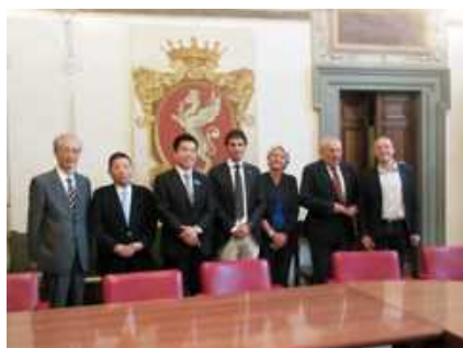
イタリア・ペルージャにて