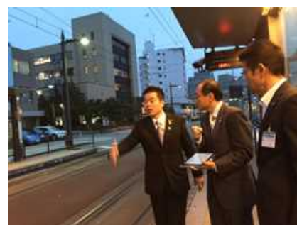
富山市 LRT を活用したまちづくり視察