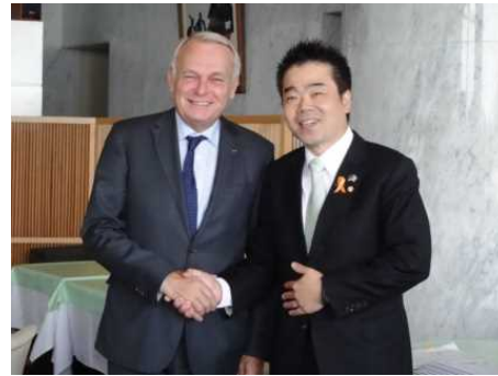
フランス外務大臣との意見交換