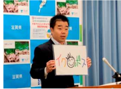
イクボス・ロゴマーク