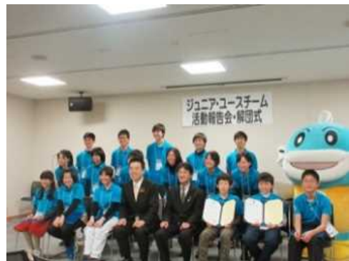
ジュニアユースチーム

○新生美術館におけるサポーター人材の育成のため、社寺などで歴史遺産の魅力を訪者に伝える講座を実施（H28 継続）