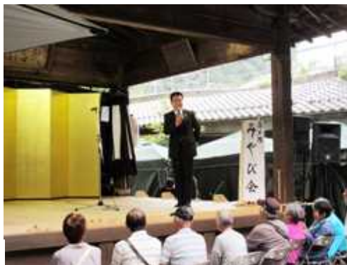
関蟬丸芸能祭にて