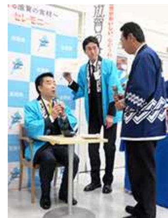
しが『食のおもてなし』～魅せる 滋賀の食材～企画メニュー発表会