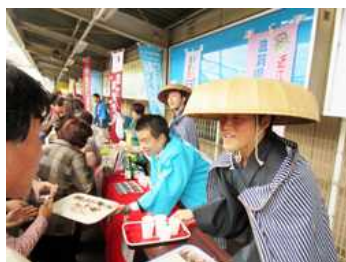
近江鉄道・おいしがうれしが電車