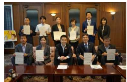
女性活躍推進企業への認証書交付