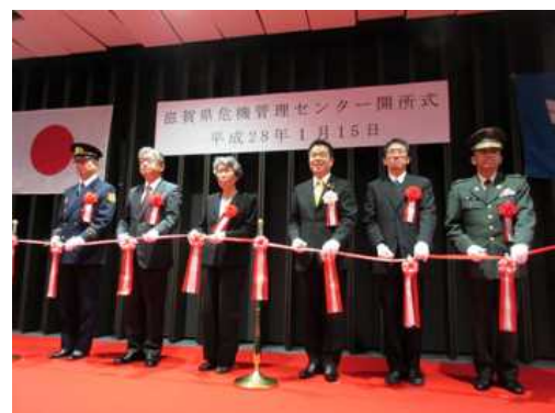
滋賀県危機管理センター開所式