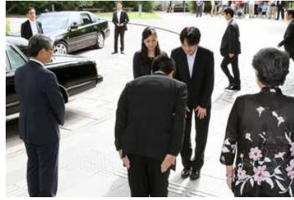
秋篠宮殿下ならびに佳子内親王殿下をお出迎え