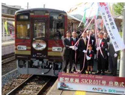
信楽高原鐵道・新型車両出発式