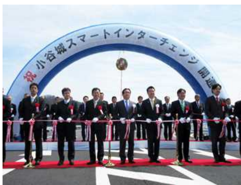
小谷城スマート IC 開通式