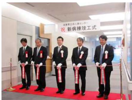
成人病センター新病棟竣工式