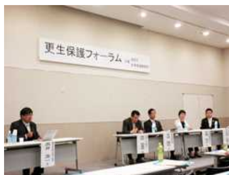
更生保護フォーラム