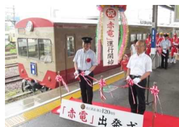
近江鉄道・「赤電」車両出発式