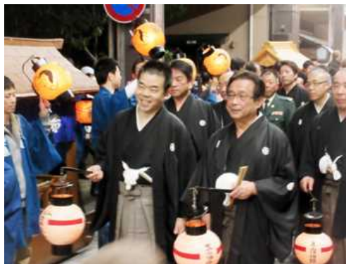
長浜曳山祭に参加