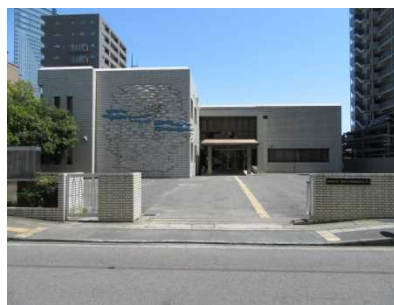
大津・高島子ども家庭相談センター