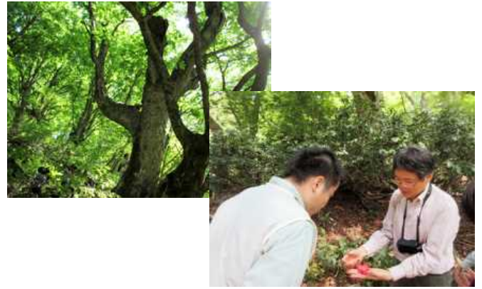
トチノキ巨木林を視察