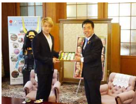
俳優の山本耕史さんとともに