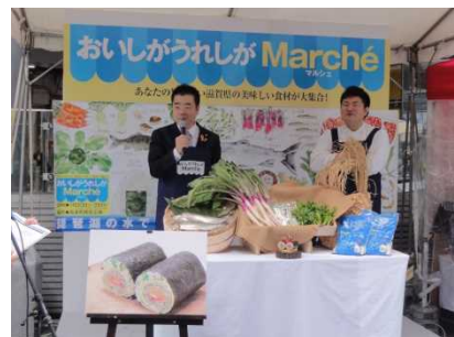
おいしがうれしがマルシェ