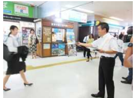
夏の節電呼びかけ