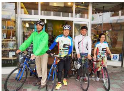
滋賀プラス・サイクル協議会の皆さんとともに

に向けたサポートステーションの社会実験や、②湖周道路に自転車の走行エリアを示す矢羽根型マーク試行設置など、「ビワイチ」の環境整備を促進