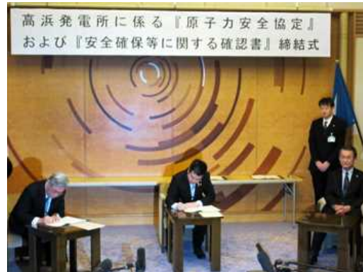
高浜原発に係る安全協定締結

☆ 平成27年度には、エネルギーに関する事項を一元的に担当する「エネルギー政策課」を設置し、「原発に依存しない新しいエネルギー社会」の構築に向けた長期的、総合的かつ計画的なエネルギー政策を推進するための指針として、平成28年3月に『しがエネルギービジョン』を策定しました。