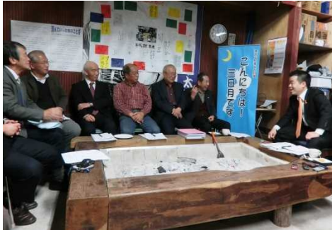
地域の助け合いモデルの視察

また、地域内の支え合いから生まれるスモールビジネスに取り組まれている団体の皆様と意見交換することで、これからの地域の在り方と暮らし方を考えました。