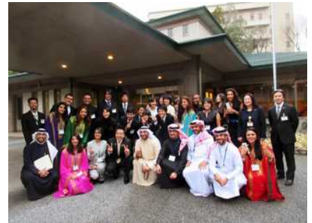
ブラジル連邦共和国とバーレーン王国の皆さん (県公館にて)

プログラムの一環で県内各地において3日間ホームステイをされる皆さんを激励するとともに、滋賀の魅力や特性を紹介しました。