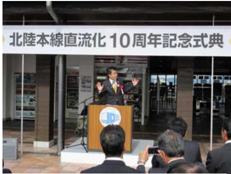
J R北陸本線直流化 10 周年記念式典