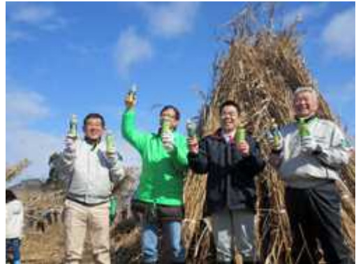
伊庭内湖でのヨシ狩り

平成 29 年 2 月には、(株)伊藤園との協働により、伊庭内湖でのヨシ刈りを行うとともに、「お茶で琵琶湖を美しく」キャンペーンの一環として、琵琶湖の自然をテーマにフォトコンテストを行いました。