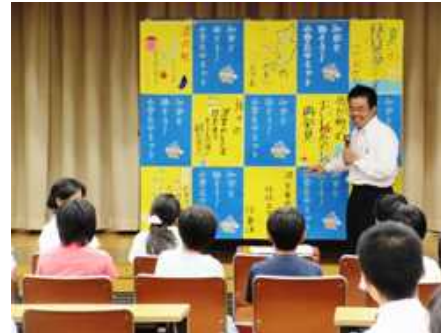
知事と話そう！小学生サミット