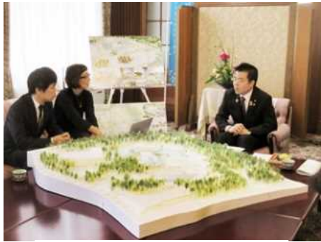
新生美術館の設計者との面談