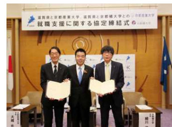
京都産業大学・京都橘大学との締結式