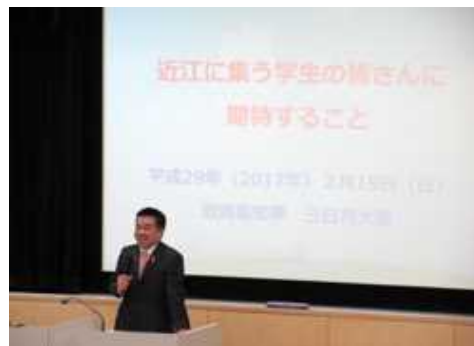
滋賀県立大学にて