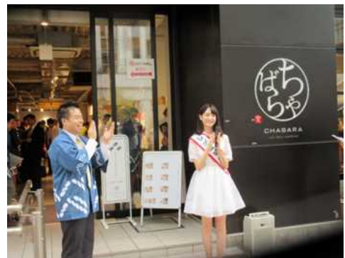
「しが広報部長」の女優・高橋ひかるさんとともに