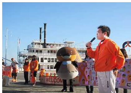
びわ湖一周オレンジリボンたすきリレー