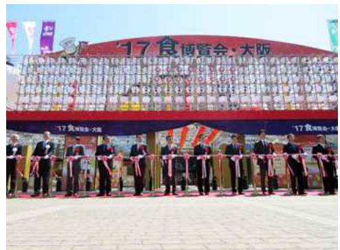
‘17 食博覧会・大阪 開会式