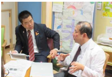
若年認知症「仕事の場」にて

平成 27 年 1 月には、若年認知症の方が内職などの軽作業をされている「仕事の場」で一緒に作業をしながら、意見交換を行いました。また、平成 28 年 1 月には認知症について正しい知識と理解を学ぶ講座を県職員とともに受講し、認知症サポーターの一員となりました。