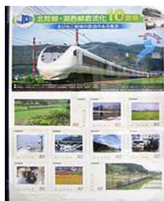
オリジナルフレーム切手 「北陸線・湖西線直流化 10 周年」