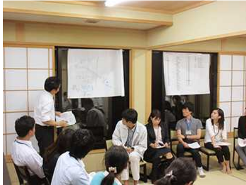
若手職員との意見交換

この戦略は、基本構想を推進するためのエンジンとして位置付け、人口目標と今後目指すべき豊かな滋賀の将来像を提示するとともに、その将来像を実現するために 19 のプロジェクトを展開しています。