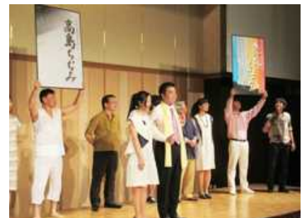
淡海の人大交流会