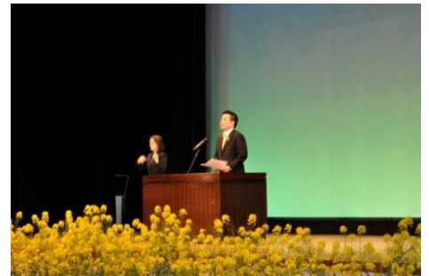
司馬遼太郎シンポジウム