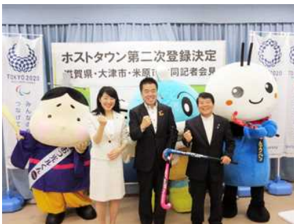
ホストタウン登録共同記者会見 (大津市長、米原市長とともに)