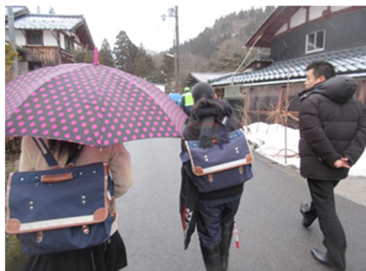
高校生と一緒にバス停へ