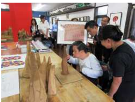
知的障害者施設「やまなみ工房」にて