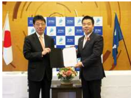
設置決定通知書手交式