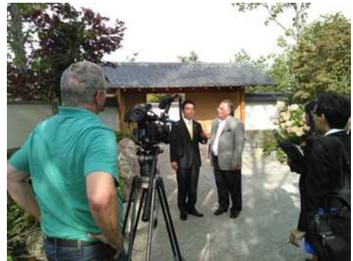
ミシガン州・マイヤーガーデンにて

その後、ミシガン州に移動し、昨年 6 月に私も参加したマイヤーガーデン滋賀プロジェクトを実施いただいた日本庭園やミシガン州立大学などを訪問しました。