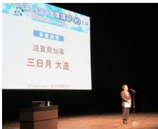
国立環境研究所 公開シンポジウム 2017