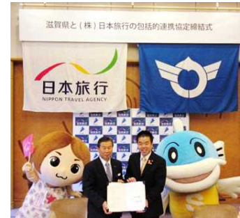
(株)日本旅行との締結式

平成29年4月に締結した「滋賀発成長産業の発掘・育成に関する連携協定」を含め、30件を超える協定が実現し、多くの分野で連携することができました。