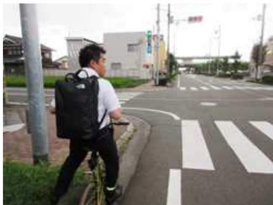
自転車による通勤

平成 28 年 7 月には、同市朽木地区にて短期居住。木材の積込みや伐採作業など林業を体験するとともに、高島トレイルを視察しました。また、県庁職員とのウェブ会議を行い、テレワークの可能性を確認しました。