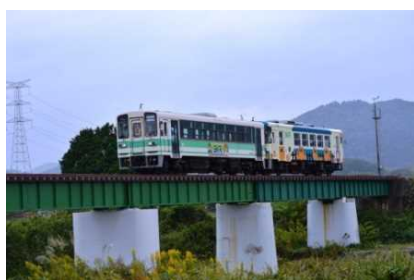
復旧した杣川橋梁（信楽高原鐵道）