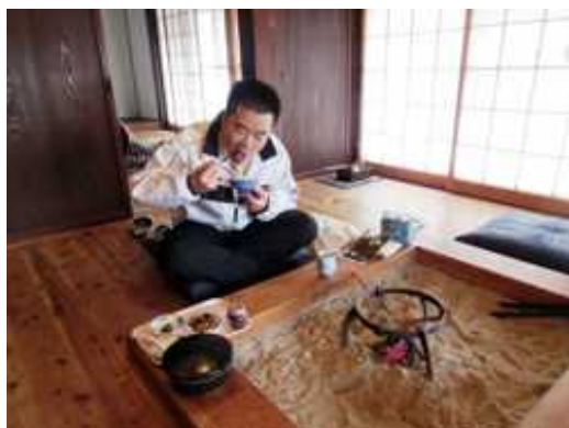
地元の無農薬米を試食

長浜市木之本町杉野に居住し、地域行事に参加するとともに、電車・バスを乗り継いで県庁まで通勤することで、地域の魅力や、冬の厳しさなどを体感しました。