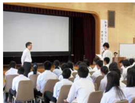
知事と語ろう！中学生サミット