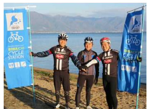
ビワイチ・サイクリング