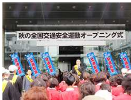
秋の交通安全運動