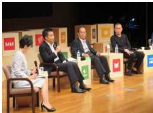
シンポジウムにて