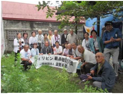
フィリピン・マニラにて