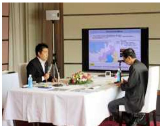
西川福井県知事との懇談

滋賀県知事と福井県知事との懇談会は 5 年ぶり。懇談会では、広域観光の連携促進を中心に北陸と中京圏を結ぶ鉄道アクセスの向上や原子力防災対策における連携、県境の道路整備、敦賀港の利用促進などについて話し合いました。