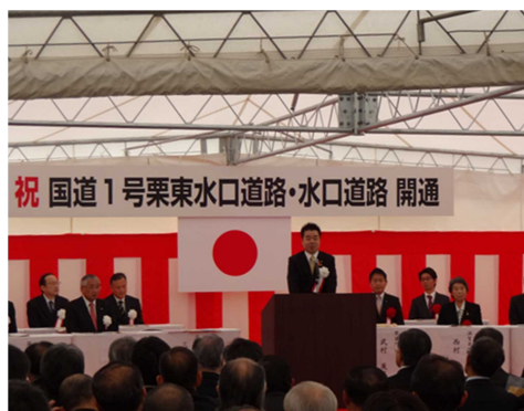
国道 1 号栗東水口道路・水口道路開通式