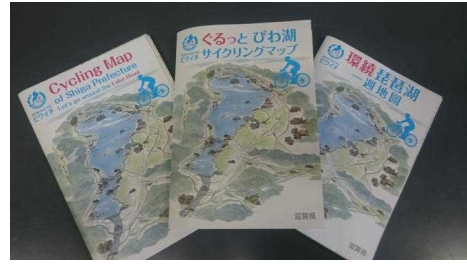
ぐるっとびわ湖サイクリングマップ