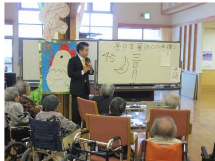
在宅医療を支える施設を訪問