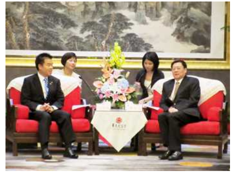
杜家毫・湖南省長と会談

☆ 平成 27 年 10 月には、マレーシアとタイを訪問し、両国からの観光客が大幅に増えているこの機会をとらえて、滋賀・びわ湖の「食と観光」を売り込むため、行政と関係事業者が一体となってプロモーションを行いました。