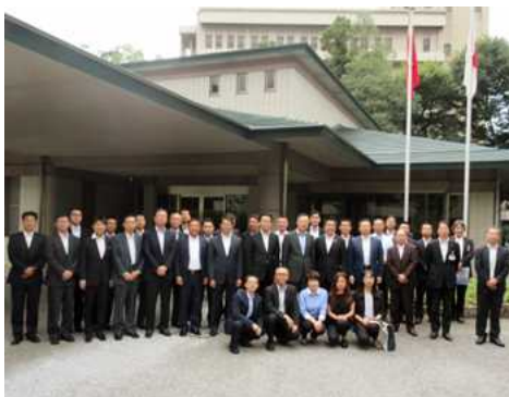
中国大阪総領事および在阪の中国系企業 の皆さん (県公館にて)

また、内閣府が行う「日本・韓国青年親善交流事業」により来日された韓国人学生の表敬訪問もお受けしました。