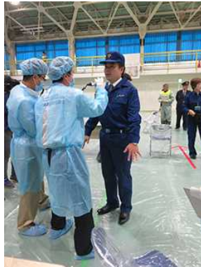
長浜での原子力防災訓練

本県が求めている立地自治体並みの同意権は、現在の協定には含まれていないなど、課題は多く残っていますが、引き続き協議を続け、協定内容の充実を目指してまいりたいと考えています。