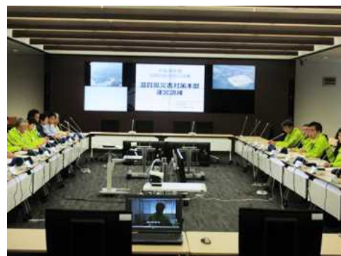
危機管理センターでの総合防災訓練