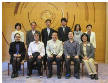
県政モニターの皆さんとともに