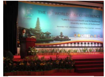
世界湖沼会議（バリ島）

☆ 平成 29 年 4 月には、関西広域連合の一員として、オーストラリアにおいて観光プロモーションを実施し、クイーンズランド州政府首相との会談や現地航空会社や旅行会社等との意見交換を行いました。