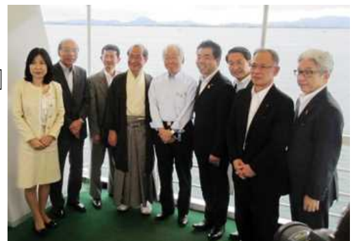
関西広域連合による琵琶湖視察