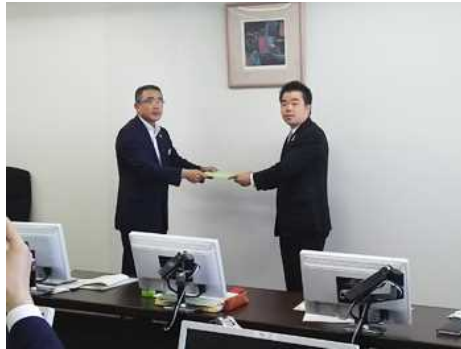
J R 西日本(株)での要望活動