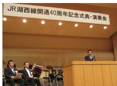
知事就任後、初の公務。 JR 湖西線開通 40 周年記念式典