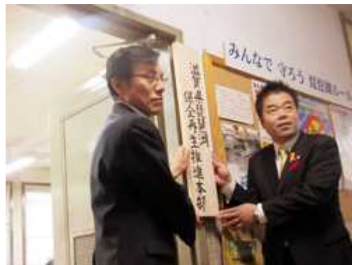
琵琶湖保全再生推進本部を立ち上げ