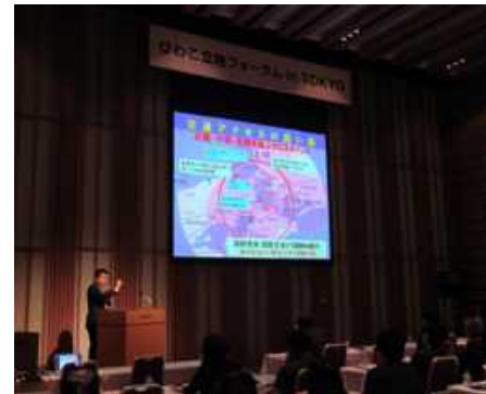
企業立地フォーラム