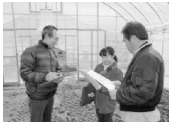
栽培開始に向けた相談

この数年、大津・南部管内における新規就農者数は増加傾向にあり、平成23年度、24年度はともに27名が就農されました。それにともない就農を希望する方からの相談も増えています。相談内容は、農業の一般情報や各種支援制度情報など多岐にわたりますが、非農家出身の方は栽培技術の習得のみならず、農地確保、農業機械や設備の整備等の課題があり、多くのハードルをクリアする必要があります。