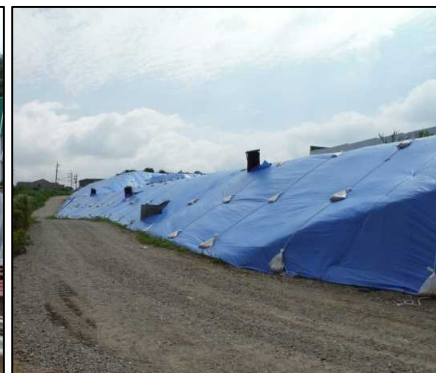
④汚染地下水拡散防止対策工