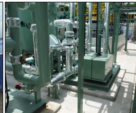
⑤浸透水处理施設工