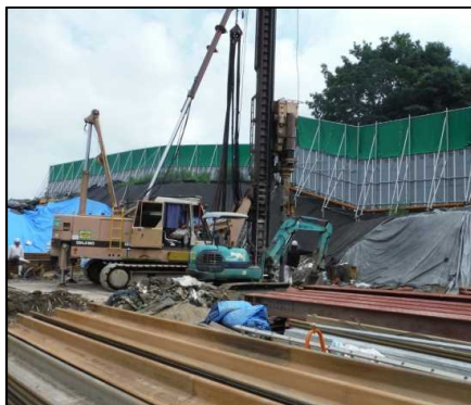
①有害物掘削除去工